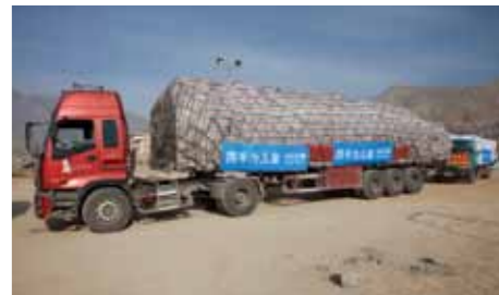
联合国儿童基金会运往灾区的赈灾物资。

重建之路任重而道远，您的爱心温暖了寒风中的孩子们，您的帮助是他们在艰难环境下最大的依傍。