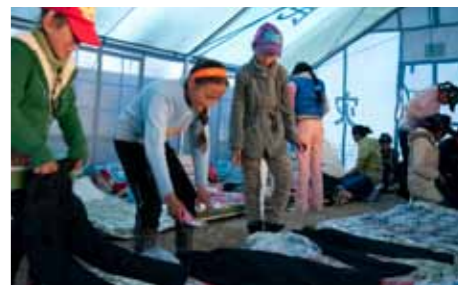
青海省玉树县结古镇中心寄宿学校的学生们领到儿童防寒服、棉裤和袜子