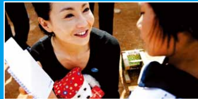
2010年4月，云南省德宏州瑞丽市某村，联合国儿童基金会中国大使张曼玉与感染了艾滋病病毒的小女孩聊天，并赠送了UNICEF小熊作为礼物。