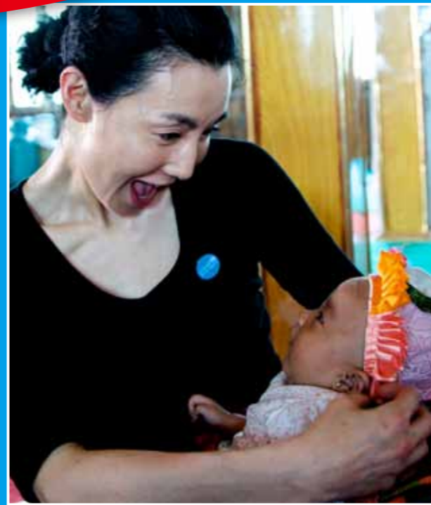
张曼玉开心地抱着一位妇女感染者所生的婴儿。联合国儿童基金会和中国政府合作开展“艾滋病病毒母婴阻断”项目，让更多的艾滋病感染妇女生下健康的孩子。

联合国儿童基金会希望在张曼玉女士的倡导下，公众能够更加关注重要的儿童权利问题，例如：支持与关怀受艾滋病影响的儿童；帮助流动儿童和留守儿童；为残疾儿童提供支持等方面。