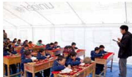
称多县的学生们搬进了联合国儿童基金会提供的帐篷学校