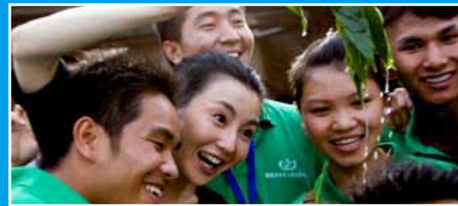
张曼玉为在社区里开展预防艾滋病宣传教育的青少年爱心大使们送上祝福。联合国儿童基金会与中国政府共同建立了“携手儿童青少年，携手抗击艾滋病”青少年爱心大使网络，旨在了解艾滋病相关信息，保护自己；分享自己的知识和经验，使他人也得到保护；关爱受艾滋病影响的同伴和家庭。