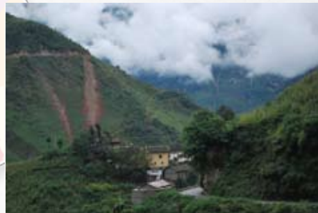
位于金三角地区向中国内陆延伸的毒品走私路线上。