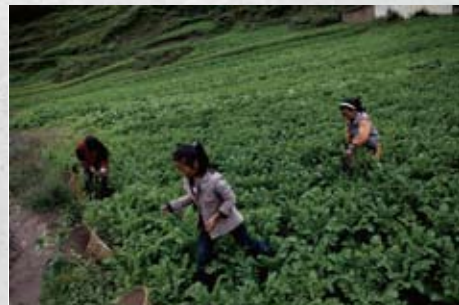
孩子们早早地进入田间干活， 很多未能完成九年义务教育。