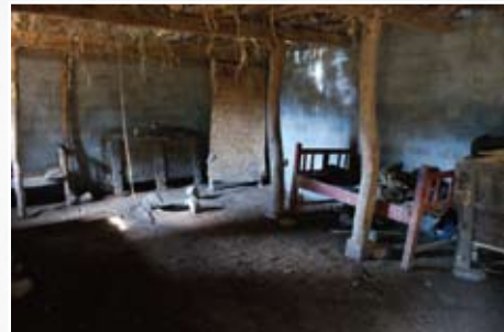
村民屋内一贫如洗，人畜共居现象仍然存在。