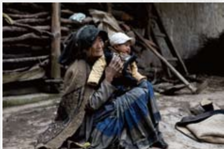
幸运的孩子有年迈的祖母照顾， 孤儿们只能自己照顾自己。