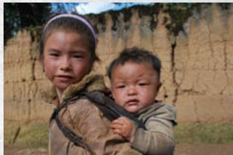
一名学龄女童背着年幼的弟弟。