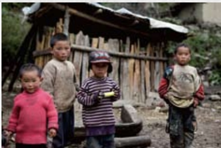
凉山孩子的日常生活