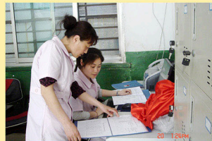
为不同类型的残疾儿童建立档案