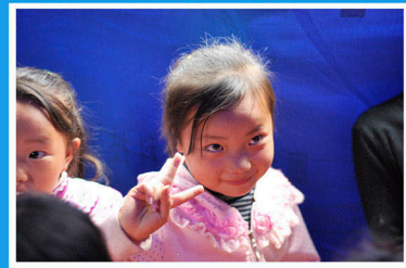
云南彝良被救助的孩子