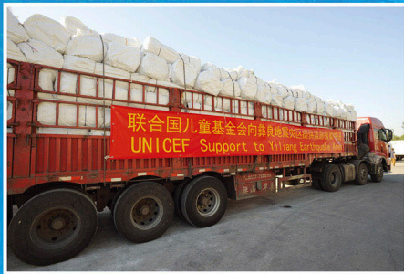
联合国儿童基金会向彝良地震灾区提供紧急援助