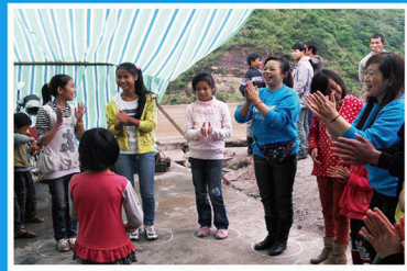
来自四川的儿童友好家园志愿者在彝良和孩子们一起做游戏

家园运作以后，志愿者们带领孩子一起游戏、组建儿童委员会、带领当地家长开展活动并参与儿童保护宣传培训。短短几天，孩子们与志愿者的感情就培养起来了。一天的服务结束，孩子们会挥着小手跟老师说再见。一位志愿者说：“看着可爱的孩子们，再辛苦也值得。”