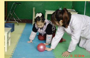
爬过来，（运动疗法）拿！