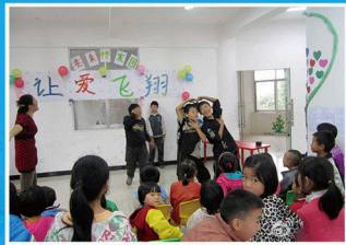
在儿童友好家园里，孩子们观看自己编排的演出

我们的项目官员克服了种种困难，只用了三天时间，三个地址确定下来了。同时，来自四川儿童友好家园的几位老师，愿意做志愿者，把他们的成功经验带到彝良。10月7日，彝良儿童友好家园正式开始服务。