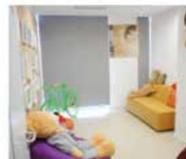
10 支付宝（中国）网络技术有限公司

我们非常欢迎您参与到“母爱10平方”的宣传推广中，您可以发动所在单位、周围的商场、娱乐场所等加入我们。详细信息请查询： http://www.unicef.cn/10m2/