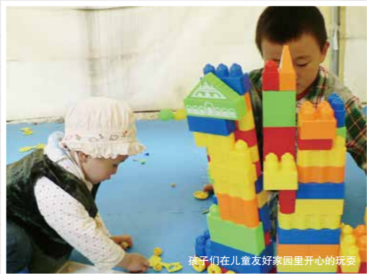
孩子们在儿童友好家园里开心的玩耍

缓解和消除地震带来的紧张情绪，激发和重塑灾区孩子们的阳光心态，促进紧急情况下儿童权利的实现和保护，正是联合国儿童基金会设立儿童友好家园的目标。