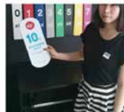
10 H&M 中国