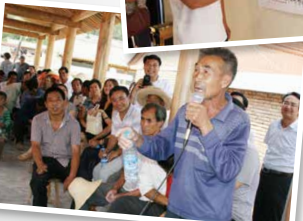
村民集体讨论决定 卫生厕所建造方案

使用卫生厕所和正确洗手，不仅关乎文明和个人尊严，更关乎生命健康。妇女、青春期女孩、儿童和婴幼儿特别容易受到不良环境卫生的影响。绝大多数因腹泻导致的儿童死亡，是由不安全供水、不使用卫生厕所和不讲究个人卫生引起的。持续腹泻和肠道寄生虫还会导致儿童营养不良，造成发育迟缓和低体重。缺乏安全、男女分开和有隐私保护的厕所，妨碍了青春期女孩的正常学习和生活。