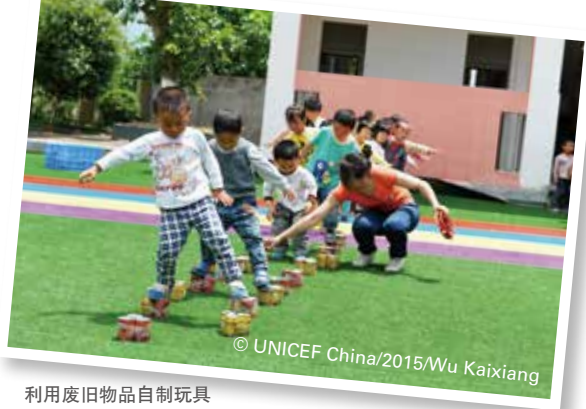
利用废旧物品自制玩具

汰下来的桌椅板凳。比缺乏玩教具更严重的，是幼儿园缺少老师，尤其是经过专业学前教育培训的老师。