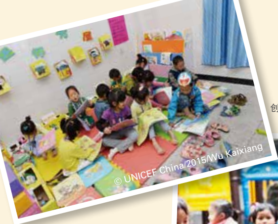
创设各种活动区角环境