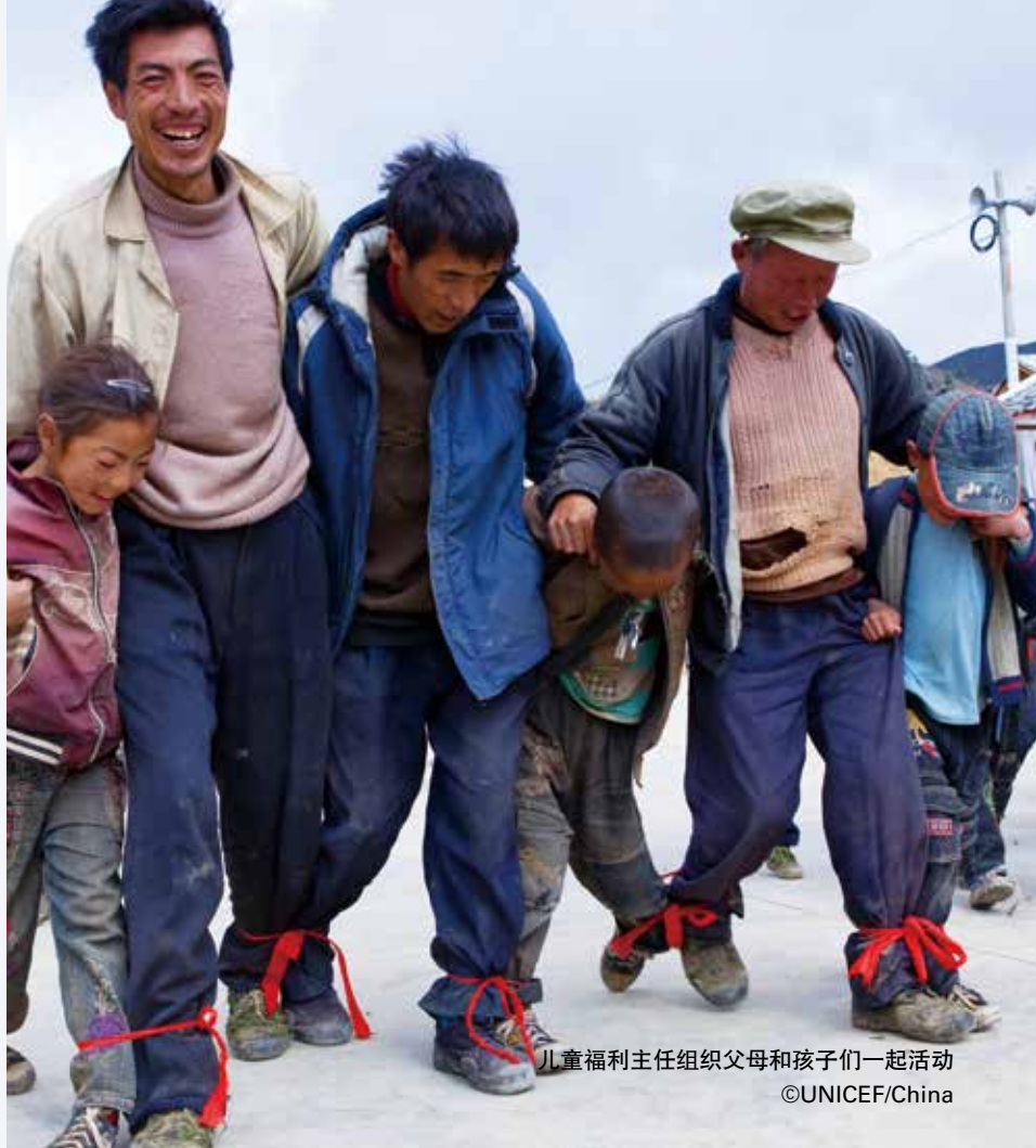
儿童福利主任组织父母和孩子们一起活动

感谢您的帮助，这些曾在灰暗生活中摸爬滚打的孩子们，不仅在生活和教育上获得了更快的服务和更多资源，心理的成长也同样得到了应有的关注。