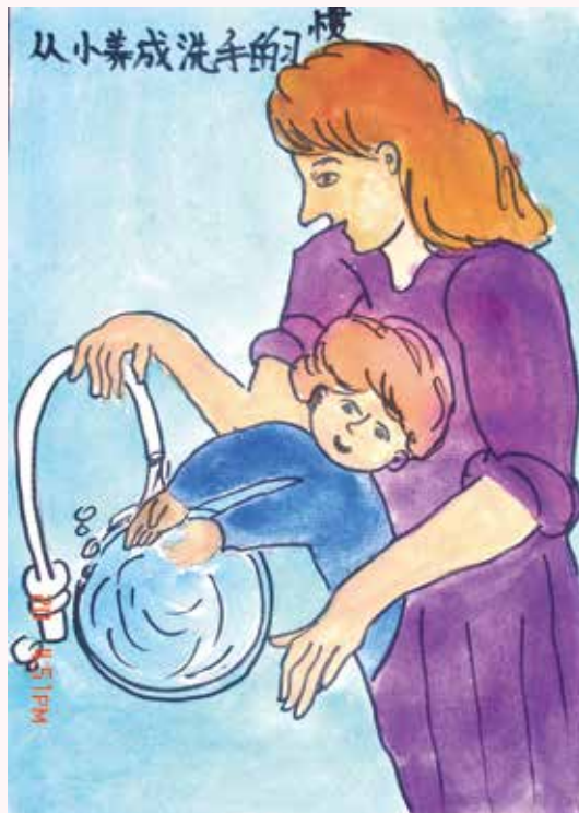
孩子们参加2015年“全球洗手日”画作