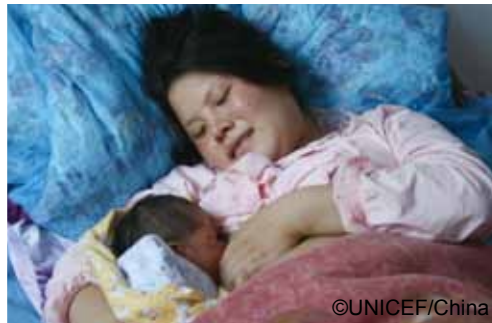
▶ 一位分娩不久后的妈妈给宝宝喂奶

• 母乳喂养使宝宝受益终生。研究发现母乳喂养给儿童成年后带来长期益处。包括：平均血压值和总胆固醇值更低，智力测验表现更佳，超体重、肥胖和 2 型糖尿病的患病率更低，心血管更健康。