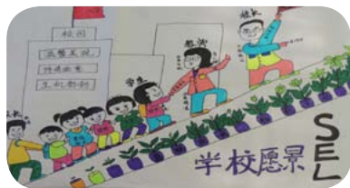
竹园土桥小学组织社会情感学习之后，老师们画出了自己的愿景