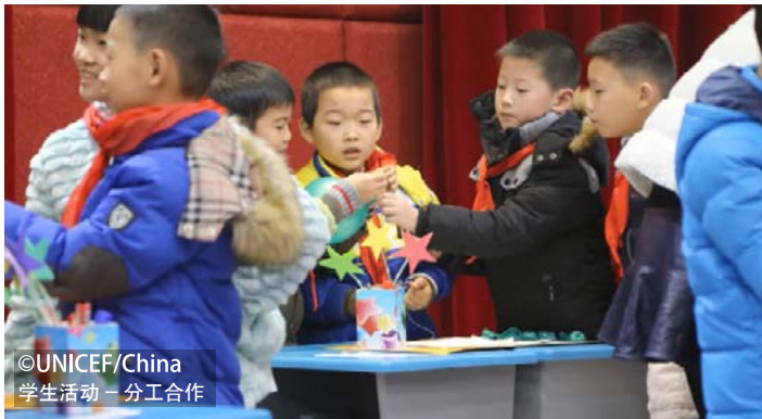
学生活动 - 分工合作